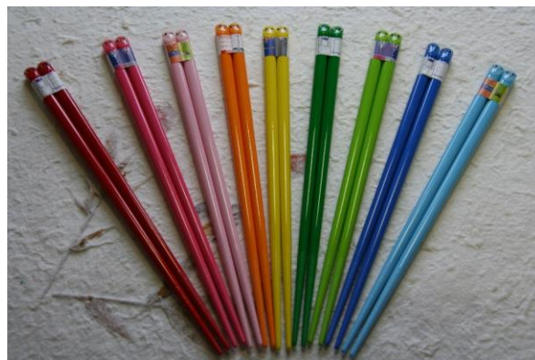
カラフルな色が特徴の塗箸