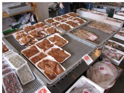
魚市場に並ぶ鯖の醤油干し

そこで、前述した、焼き鯖、へしこ、なれずし、小鯛ささ漬に加え、地域で古くから伝わっている鯖の干物の「鯖の醤油干し」を本市のふるさと名物に指定し、域内外に広く発信するとともに、さらなる販路開拓を支援します。