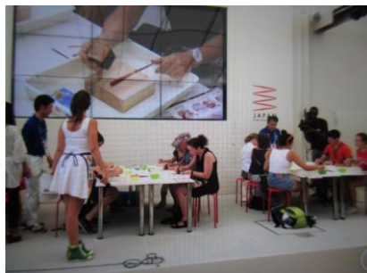
ミラノ万博での出展

市と若狭塗箸協同組合の協働で、平成27年にはミラノ国際博覧会にて若狭塗箸のPRブースを出展したほか、平成28年からは香港でのPR活動も行っています。