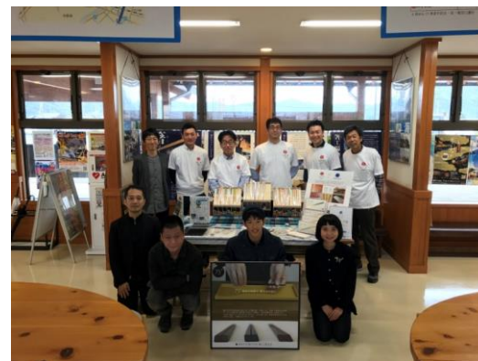
学生とのコラボレーション作品のお披露目会