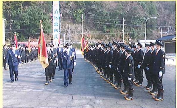
観閲式 (おおい消防団)