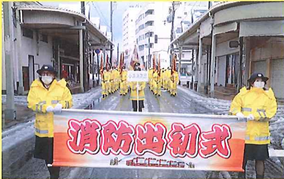
市中行進 (小浜消防団)

平穏無事な一年であることを祈願しそれぞれの行事が行われる中、消防職団員は今年一年の防火に対する決意を新たにしました。