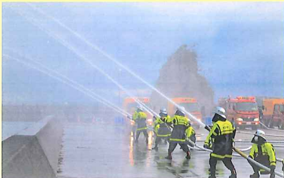
一斉放水 (高浜消防団)