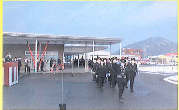
分列行進 (上中消防団)