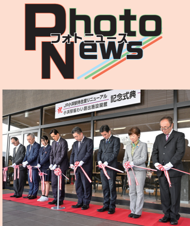
「待つ駅から行く駅へ」をコンセプトにJR小浜駅待合室リニューアルと小浜駅賑わい創出施設開館を関係者が祝う(駅前町・3月2日)