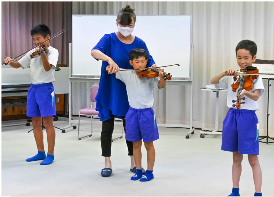
音楽鑑賞会でバイオリン演奏を体験(今富小学校・6月27日)