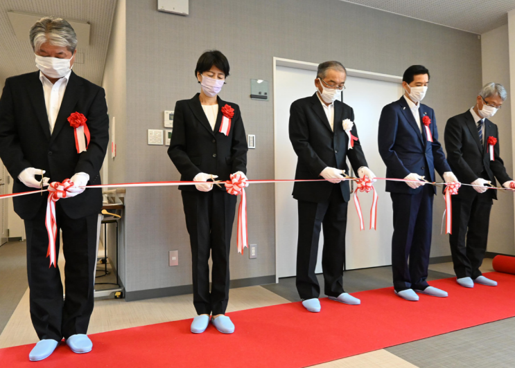
利用者が作業などに取り組む新拠点 障がいのある人たちが通所する社会福祉法人若狭つくし会の新しい事業所が完成（水取四丁目・6月7日）