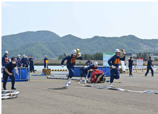
気合い十分 4年ぶりに大会 「小浜消防団消防操法大会」に2種目計10チームが出場し磨き上げた技能を披露（川崎三丁目・6月19日）