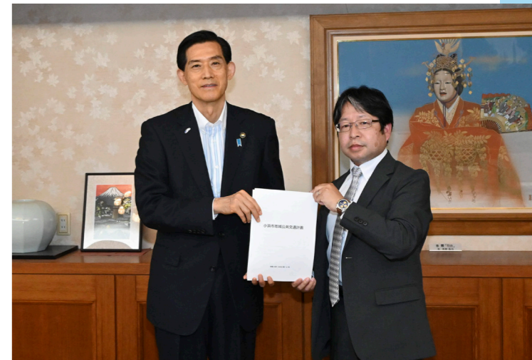
地域交通の方針を示す 市で初の計画 住民代表などが参加する市地域公共交通会議が「小浜市地域公共交通計画」を取りまとめ松崎市長に報告（市庁舎・6月27日）