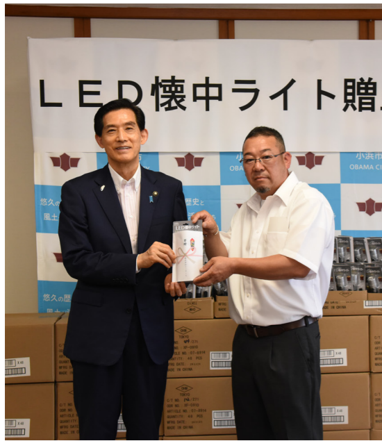
地域の防災や防犯に役立てて 電気工事業を営む(株)エーアールが市にLED懐中ライト1,250個を寄付（市庁舎・6月17日）