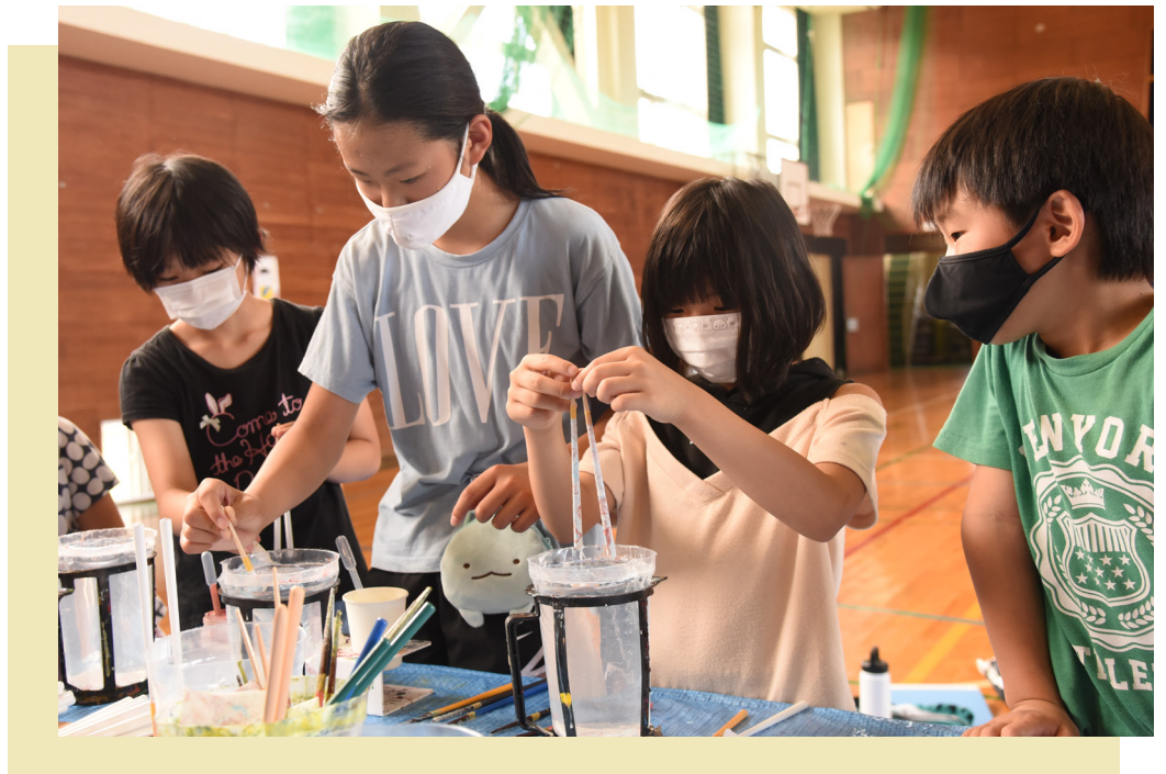
小浜の魅力をこめた箸づくり体験(雲浜小学校・6月22日)

https://www1.city.obama.fukui.jp/ kouhou@city.obama.lg.jp 若越印刷(株)小浜営業所