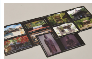
▲文化遺産カード(手前2枚が第3弾)

金 無料（別に拝観料や入館料がかかる場合があります） 問 小浜市の歴史と文化を守る市民の会（文化交流課内） ☎ 64・6034