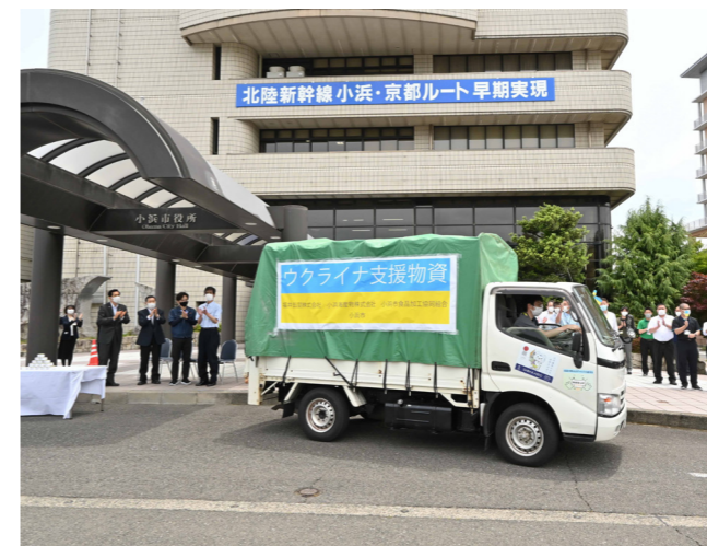
ウクライナの平和を願って 市内企業2社と1組合から提供を受けた2,400缶のさばの缶詰をウクライナ避難民の元へ発送（市庁舎・6月13日）