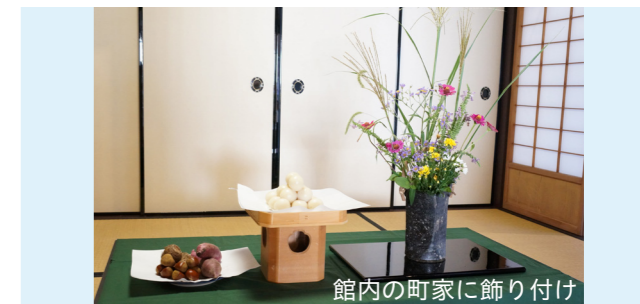
館内の町家に飾り付け