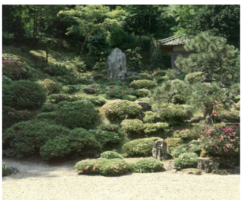
▲庭園は手入れされた山へと続き、全体で約1,800平方メートルの広さと言われています

前方に白砂が敷きつめられ、奥には3層の巨石を中心に石が、その間をツツジや松などの樹木が飾る築山風の光景が広がります。また、さらにその先は広大な山へと続いています。一説によると、巨石が真言宗の仏「大日如来」を象徴し、庭全体が曼荼羅を表現していると言われています。