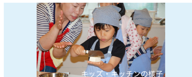
キッズ・キッチンの様子