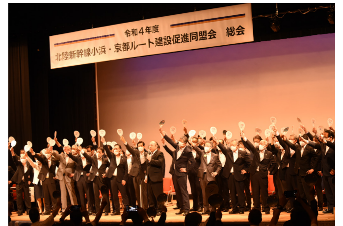
北陸新幹線小浜・京都ルート早期実現に向け 令和12年度末の小浜・京都ルート全線開業に向け3年ぶりに建設促進同盟会総会が開催（文化会館・6月18日）