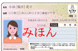
▲おもて面には、顔写真や氏名、住所、生年月日などが記載

この10月からは、事前に登録することで健康保険証としても利用でき、今後は、運転免許証との一体化なども予定されています。