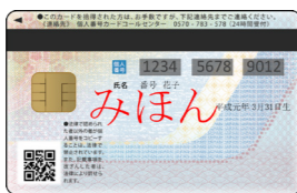
▲うら面には、マイナンバーのほか、電子証明に使うICチップも搭載