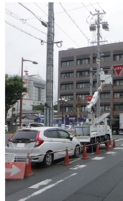
伝送路設備工事のイメージ

高所作業車を使用して光ファイバケーブルを設置する工事を行います。通行などに支障をきたす場合がありますが、ご理解とご協力をお願いします。