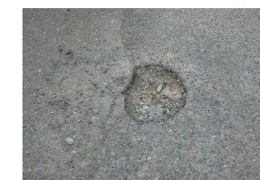
直径約20センチのくぼみができたアスファルト

市民の皆さんが、道路の陥没や、側溝のふたのひび割れなどといった損傷を発見した場合は、都市整備課まで連絡してください。