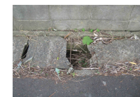
ひび割れ、一部が欠けた側溝のふた