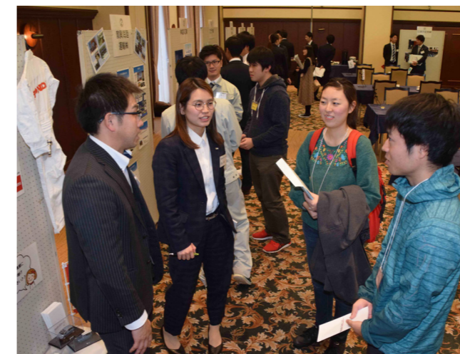
社会人の先輩と気軽に懇談 就活イベント「縁job ふくい嶺南」で嶺南に事業所がある企業と学生が交流（日吉・12月28日）