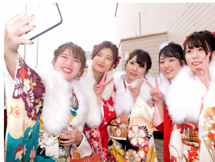
大人としての決意新たに節目を祝う 本市の新成人293人中248人が振り袖やスーツ、はかま姿などで成人式に参加（文化会館・1月12日）