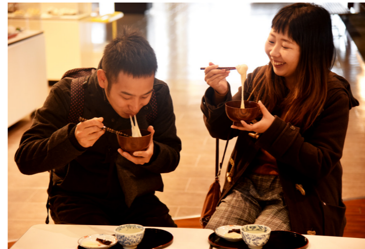
食文化館で「食」初め 来館者に振る舞われた黒砂糖入り「雑煮」を食べ、小浜に伝わる味に舌鼓（食文化館・1月2日）