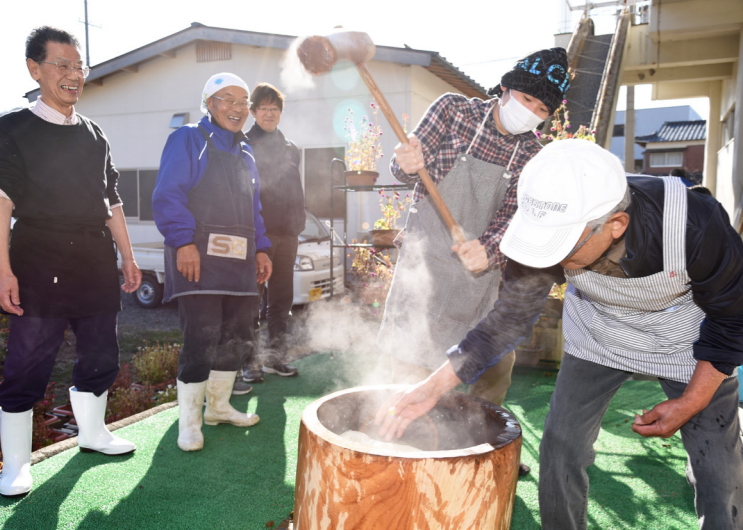
事故のない安全な暮らしを祈って餅つき 「西津やうちのシルバーカフェ」と若狭交通安全協会西津班が合同で餅つき大会を開催（西津公民館・12月25日）