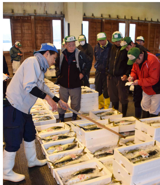
新年も威勢良く響く競りの声 小浜漁港の初競りでサワラやタイなど約30トンの新鮮な魚介類がずらりと並び（川崎三丁目・1月5日）