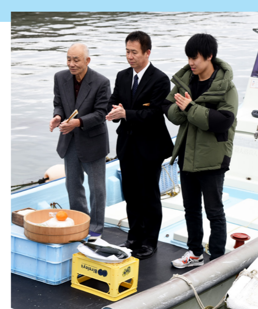
船上で豊漁と海の安全を願う 正月の伝統行事「舟祝い」で犬熊区の漁家が今年一年の豊漁と海の安全を祈願（犬熊漁港・1月1日）