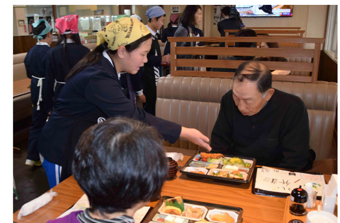
“地元の宝” あおしま 蒼島を弁当に 加斗小6年生15人が国の天然記念物「蒼島」をテーマにした弁当「加斗の宝スペシャルメニュー」を考案（岡津・12月17日）