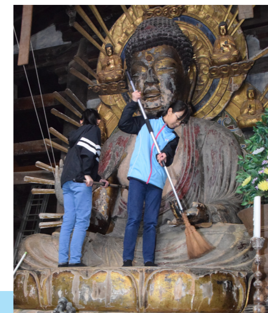
すずを払って晴れやかな年越しを 国分文化財愛護少年団の団員4人が国分寺で釈迦如来坐像などを掃除（国分・12月28日）