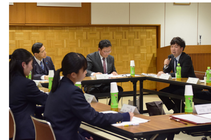
若者たちの意見を市政に生かす 「若者と市長の夢トーク」で若狭高校生や宮川青年クラブがまちづくりについて意見を交わす（市庁舎・12月17日）