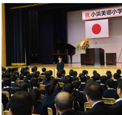
新たに開校した小浜美郷小学校には、市内最多の300人超の児童が通う

文化財については、近年は全国的に保存優先から活用へと方針転換が進んでおり、本市の2つの日本遺産を生かした地域活性化の取り組みは全国モデル事業として注目を浴びています。今年3月には、いづみ町に「鯖街道ミュージアム」がオープンするほ