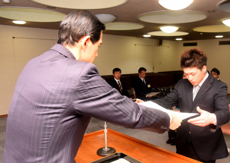
優秀な成績収めた選手・団体たたえる 「福井しあわせ元気」国体・障スポなどで活躍した13個人、2団体を表彰（文化会館・3月20日）