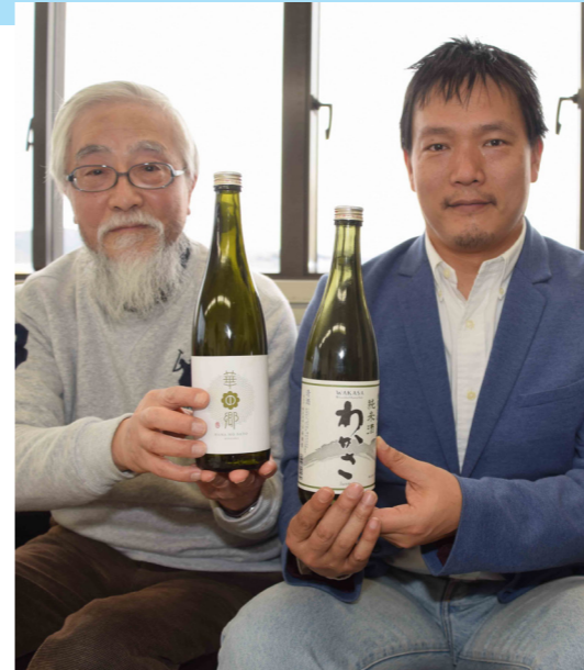
投資型クラウドファンディングを活用 小浜酒造が新商品開発プロジェクトの開始を発表。2日間で目標額400万円を集める（市庁舎・3月20日）