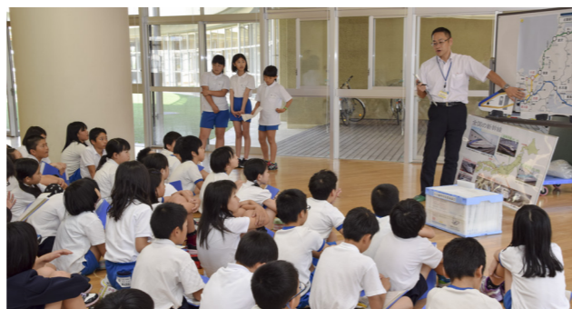
北陸新幹線の出前講座 (小浜小学校)

市では、市職員が地域に向き、市政の現状を市民の皆さんに分かりやすく説明する「出前講座」を実施しています。多くの皆さんの積極的なご利用をお待ちしています。