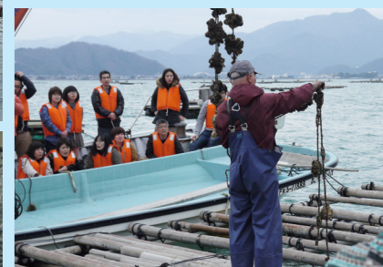
左上/ワカメ漁体験 左下/海の生き物調査 右上/サイエンス民宿 右下/カキいか見学