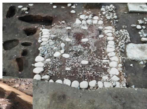
上/追加指定範囲の位置図 中/若狭武田氏館跡石敷き遺構(写真①) 下/若狭武田氏守護居館西側堀跡(写真②)