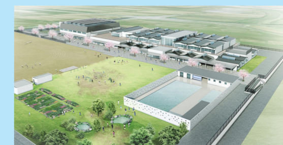
小浜美郷小学校の完成イメージ図

【決定理由】「小浜の美しい郷土」として、東部 4 地区の田園風景がイメージできる。自分たちが住む郷土に誇りを持って子どもたちに学んでほしいとの思いが込められている。