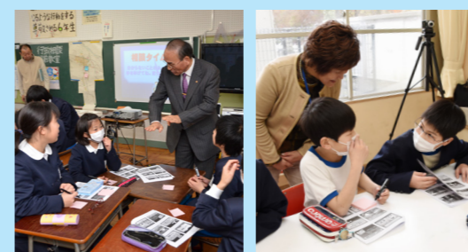
行政相談についての小学校出前教室（左／遠敷小学校・2 月 16 日、右／加斗小学校・2 月 17 日）