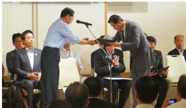
西川知事から松崎市長に開催決定通知書を交付(福井商工会議所・8 月 17 日)

全体会期 平成 30 年 9 月 29 日(土)～10 月 9 日(火) (11 日間)