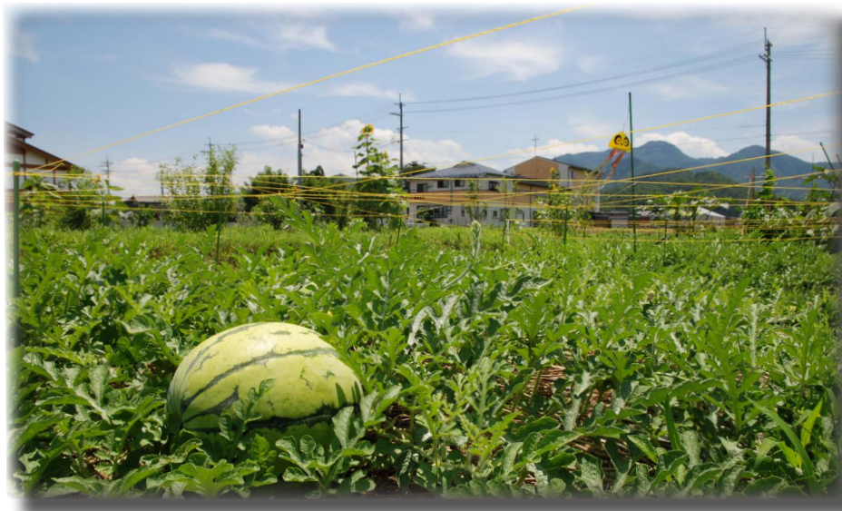
道の駅「若狭おばま」に隣接する市民農園。スイカのほかに、トマトやナスビなどの夏野菜が太陽の光を浴びて大きく育っていました(7月10日撮影)