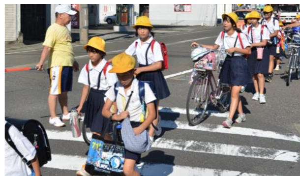
児童を見守る通学ボランティア（小浜小学校付近）

守る通学ボランティアが発足しました。市内の全小学校でも、登下校の付き添いや危険な場所での安全確保などを行っています。子どもを見守っているのは通学ボランティアや保護者だけではありません。通学路の途中にある家の人や散歩中の人も積極的に声掛けをしています。まさに、地域が一体となった取り組みです。