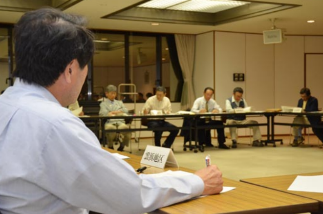
5月18日、新たなまちづくりの説明会