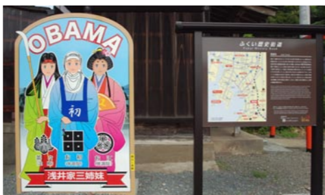
常高寺の顔出し看板（昨年度のいいとこ小浜づくり活動支援事業の採択事業）

市民、団体、事業所、行政それぞれが役割を理解し、行動していくため、協働の手引きとなるガイドラインの策定が急がれます。