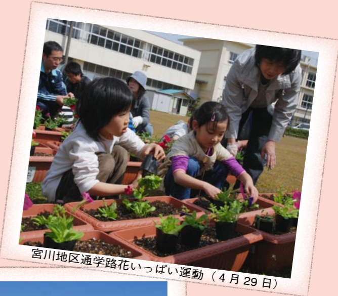
宮川地区通学路花いっぱい運動（4月29日）