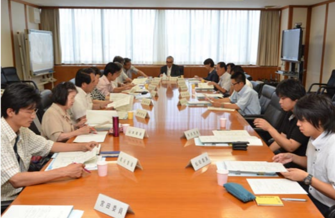
第1回協働のまちづくり市民会議（7月14日）

第5次総合計画で、協働とは「対等な立場でお互いを理解し、認めあい、責任を共有しながら協力していくこと」と記していますが、協働は今までなかった訳ではありません。地域力づくりそのものが協働で行われ