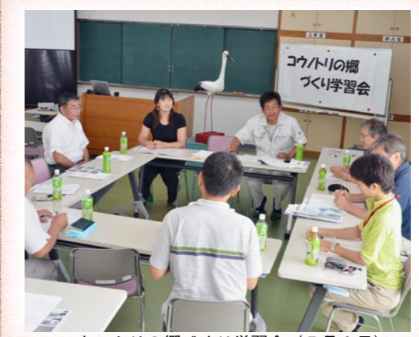
コウノトリの郷づくり学習会（7月2日）