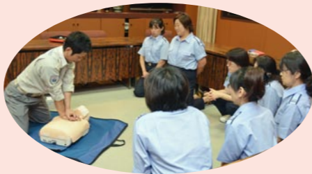
救命法の講習を受ける隊員