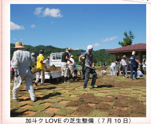
加斗ク LOVE の芝生整備（7月10日）