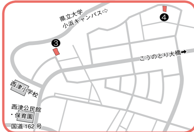
③山王前二丁目1102番1 ④松ヶ崎二丁目714番1