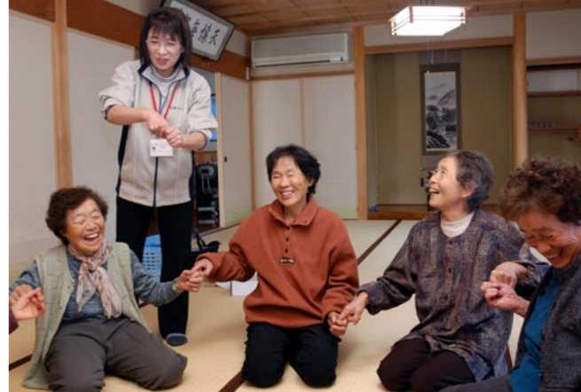
ふれあいサロンの様子（羽賀区）

公民館をはじめ、地域の皆さんのサポートがあってこそ、わたしたち高齢者が安心して活動できると思っています。お返しの意味を込めて、ふるさとまつりなど地区の行事には主体的に参加していきたいですね。