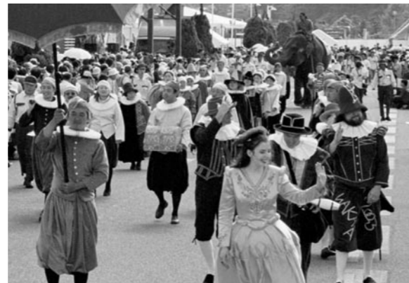
若狭路博2003での千年行列(平成15年・川崎区)

平成22年には、おばま観光局が発足。現在、体験型観光の推進やにぎわい創出のための企画などさまざまな取り組みを展開中です。