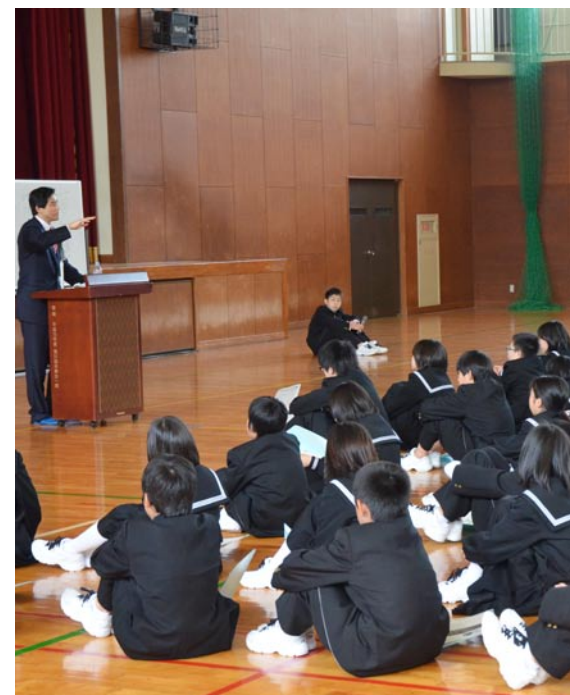
市長と夢トーク（5月13日・小浜第二中学校）

次世代を担う子どもたちが、自由なアイデアで将来を考えることで、まちづくりに興味を持つだけでなく、く、考察、議論する場を設けて、人材育成につなげることを目的に行われた「We Love OBAMA 発表会」。