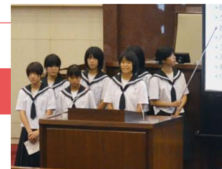
おしゃれな農業を提案した二中 A チーム