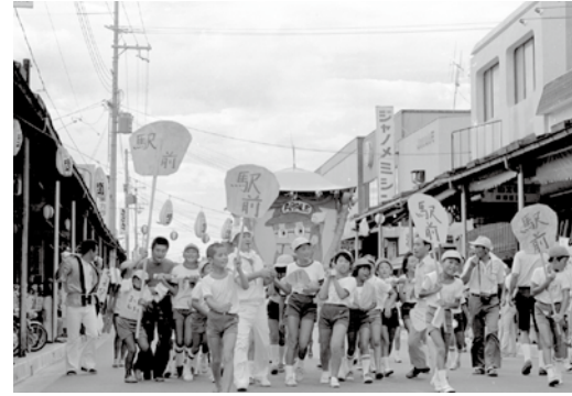
市制 30 周年記念の夏祭り (昭和 56 年・駅通り)

昭和 60 年には、若狭かれいが皇室に初めて献上されました。若狭かれいは、古くから高級食材として都に運ばれ、現在でも毎年皇室に献上されています。