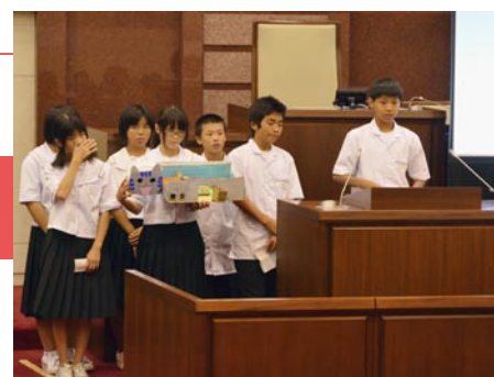
海を家の模型を披露する浜中 B チーム

海の家を設立 (子どもから大人まで楽しめる) カフェ (鯖そうめん、煮ダコ) 海のイベント (バナナボート、ビーチバレー、ベースボール、浴衣コンテストなど)