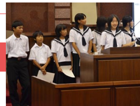
自然を生かしたまちづくりを提案した二中 B チーム