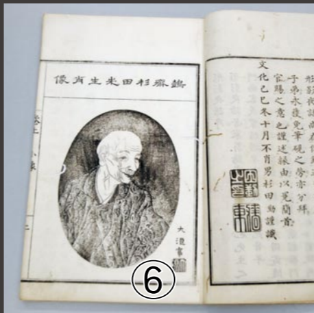
写真の史料を知っていますか？正解は4ページ