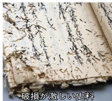
破損が激しい史料

五十四点を修繕しますが、これらの貴重な財産を後世に残していくためには、残りの史料も早急な修繕が必要になっています。