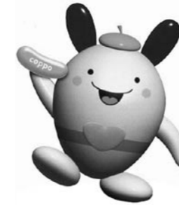
国保のイメージキャラクター「コッポちゃん」