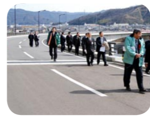
整備が進む若狭西街道。2月25日には生守・谷田部間が開通しました