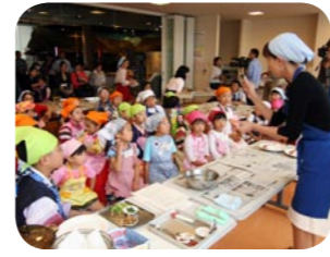
キッズ・キッチンを中心とした食育事業を推進します