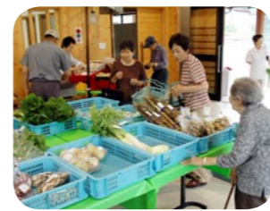
特産作物の推進、水田の高度利用などに補助します