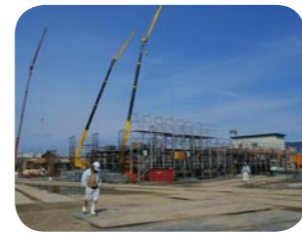
順調に工事が進む小浜小学校