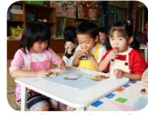
乳幼児医療費の助成額を拡大します