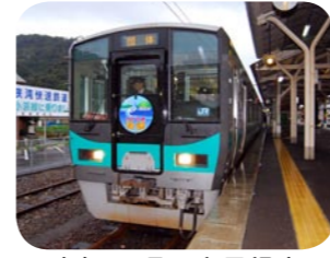
昨年11月、市民提案の1つ「わかさ路快速」が運転されました