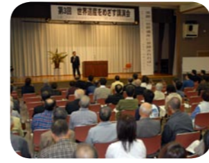
世界遺産暫定リスト登録を目指した講演会を開催します